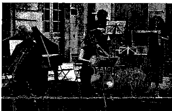
Fête de la musique 2006